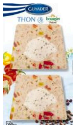
Bel arrive avec cinq nouveaux produits co-brandés avec Guyader et Fleury Michon

Bel Foodservice PAI, spécialiste des fromages ingrédients pour l'industrie et les chaînes de restauration a concrétisé 5 nouveaux co-branding au 1 er trimestre 2014.